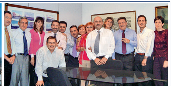
Oben: Das Team der VTG España bietet neben der Waggonvermietung auch schienenlogistische Lösungen an. Above: The VTG España team offers wagon hire as well as rail logistics solutions.