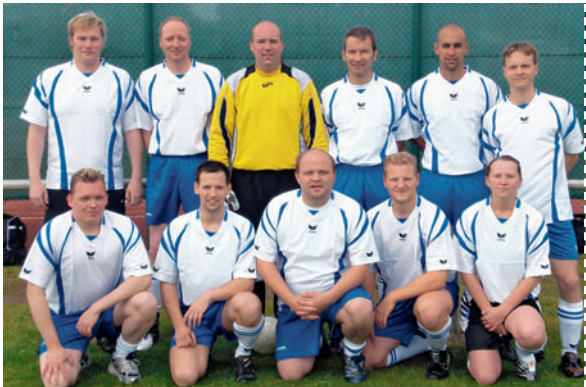
Die Mannschaft der Transpetrol The Transpetrol team

Auch in diesem Jahr gab es zur Kieler Woche wieder einen „Transpetrol-Flüssiggastörn“ an Bord der Nordstjernen. Bei herrlichem Wetter konnten die Teilnehmer – hauptsächlich LPG-Kunden der Transpetrol – das größte Segelsportereignis der Welt vom Wasser aus beobachten. Nach dem Anlegen ging es weiter zum kulturellen Programm an Land und zum fröhlichen Feiern unter freiem Himmel. Hoffen wir nächstes Jahr wieder auf so gutes Wetter! This year, Transpetrol’s “sail for liquefied gas customers” was held again on board the “Nordstjernen” at Kieler Woche. In splendid weather, the participants – mainly LPG customers of Transpetrol – were able to admire the world’s largest sailing event from the water. After tying up, they went on to enjoy the cultural programme on shore and cheerful celebrations under a cloudless sky. Let’s hope for such brilliant sunshine again next year!