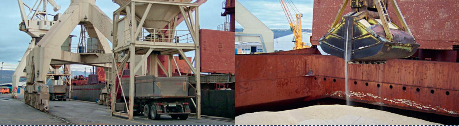
Kombination aus Binnenschiff und Lkw: Rohzuckertransporte in die Slowakei und nach Ungarn Combining inland waterway vessel and lorry: raw sugar transport services to Slovakia and Hungary