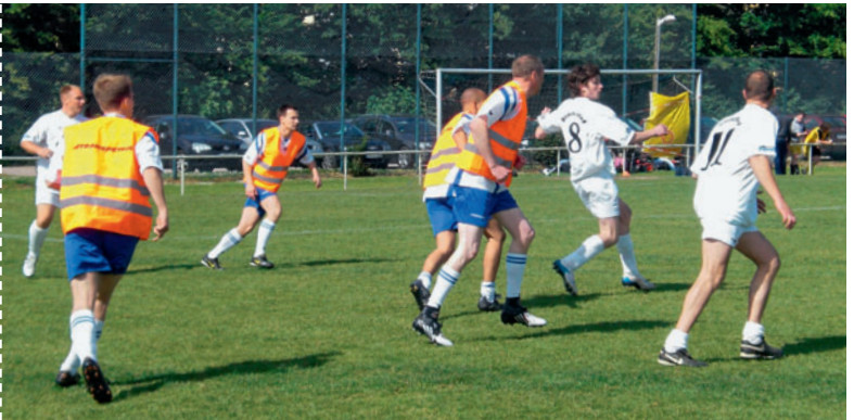
Strahlender Sonnenschein beim Turnier Glorious sunshine for the tournament